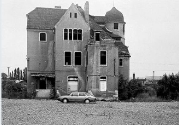
Steffen Groß, Haus mit Saab , 2005, C-Print (analog) hinter Acrylglas, 130x160 cm