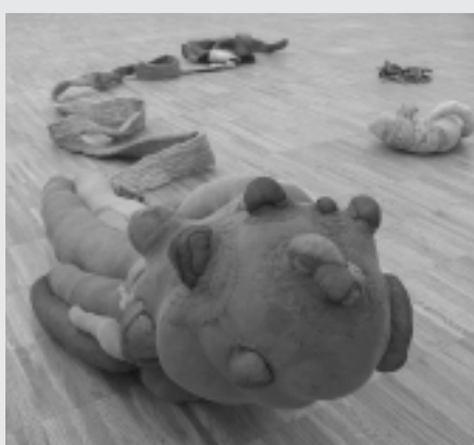
Annakathrin Schreiber, o.T. , 2004, Strumphosen unterschiedlicher Farbe, Schaumstoff