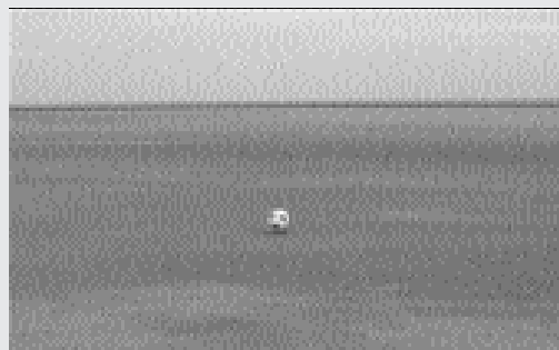
Till Rickert, fussball , 2002, Videostill