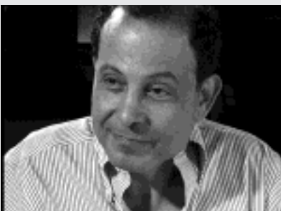
Boisseau / Westermeyer, Le groupe du mercredi , Video Installation, 2005

Die Arbeit Eine Stadt drückt sich aus besteht aus über 200 Stempeln mit