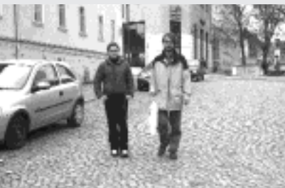
Boisseau / Westermeyer, Filiation , Video, 2002

"Take care" meint "Mach's gut" aber auch "Pass auf Dich auf". Dieses "Take care" zum Abschied gesagt zu bekommen, gab dem Künstlerpaar immer das Gefühl, freundliches Terrain zu verlassen und sich in nicht-freundliches Gebiet zu bewegen. Der Abschiedsgruß ist ein Warnhinweis in einer Frontier-Gesellschaft, in der die eigene Community, die "good neighborhood", Vertrautheit und Sicherheit bietet, während gleich nebenan unvertraute und gefährliche Zonen lauern, die es sicher zu durchschreiten gilt.