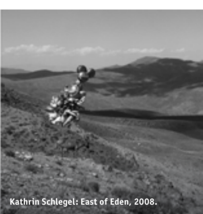
Kathrin Schlegel: East of Eden, 2008.