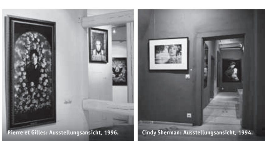
Pierre et Gilles: Ausstellungsansicht, 1996.