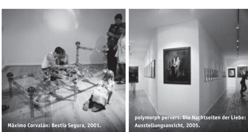
Máximo Corvalán: Bestia Segura, 2001.

polymorph pervers. Die Nachtseiten der Liebe: Ausstellungsansicht, 2005.