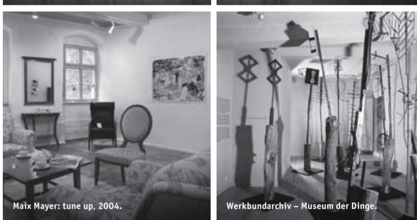
Maix Mayer: tune up, 2004.

polymorph pervers. Die Nachtseiten der Liebe: Ausstellungsansicht, 2005.