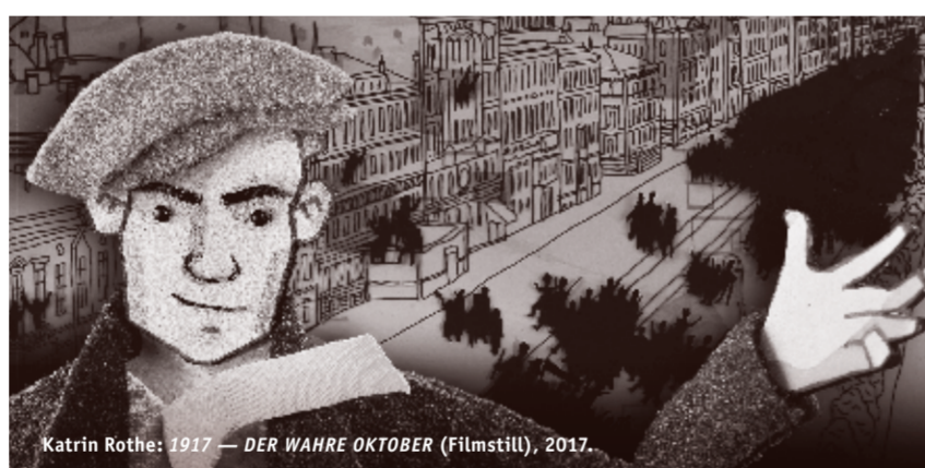
Katrin Rothe: 1917 — DER WAHRE OKTOBER (Filmstill), 2017.