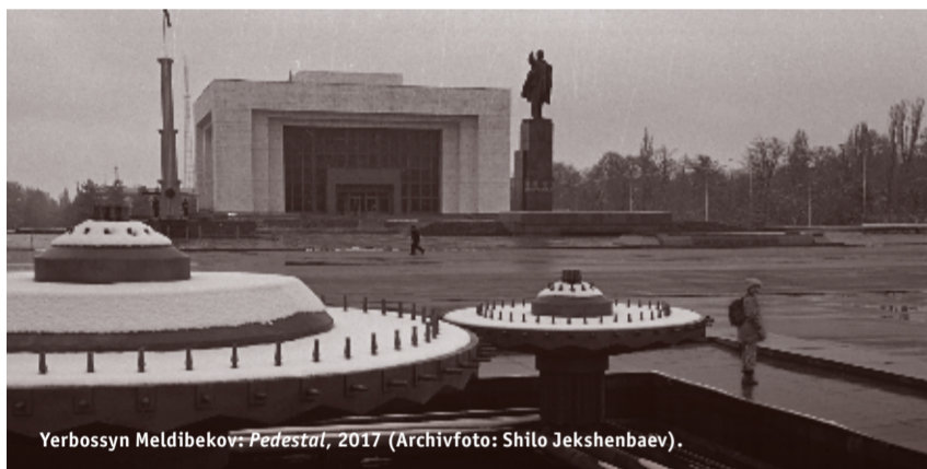
Yerbossyn Meldibekov: Pedestal , 2017.