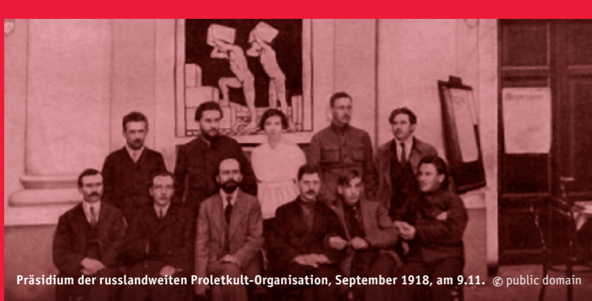
Präsidium der russlandweiten Proletkult-Organisation, September 1918, am 9.11.

Do 9.11.2017 | 20:00 Kunst, Spektakel & Revolution Die Oktoberrevolution in der Kunst | Kerstin Stakemeier, Berlin