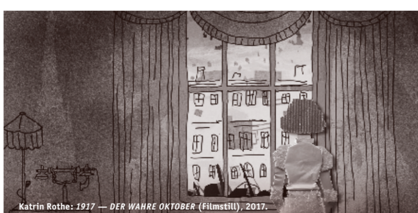
Katrin Rothe: 1917 — DER WAHRE OKTOBER (Filmstill), 2017.