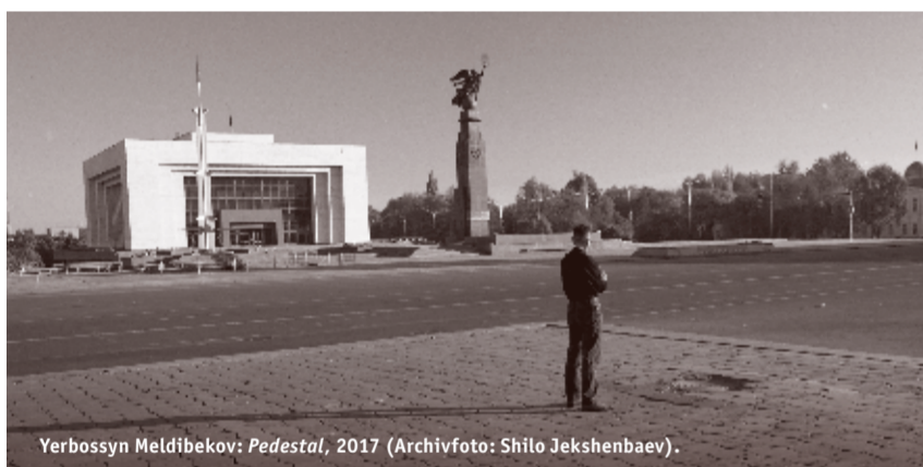
Yerbossyn Meldibekov: Pedestal , 2017 (Archivfoto: Shilo Jekshenbaev).