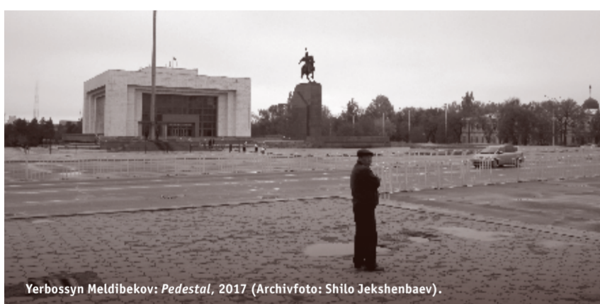
Yerbossyn Meldibekov: Pedestal , 2017.