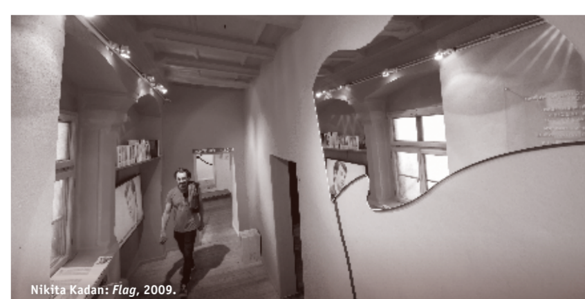
Nikita Kadan: Flag , 2009.