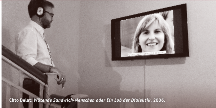
Chto Delat: Wütende Sandwich-Menschen oder Ein Lob der Dialektik , 2006.