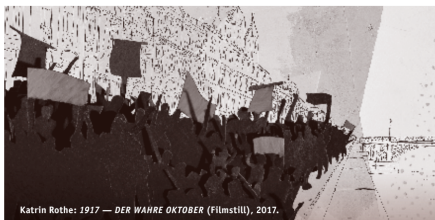
Katrin Rothe: 1917 — DER WAHRE OKTOBER (Filmstill), 2017.