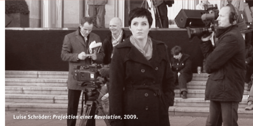
Luise Schröder: Projektion einer Revolution , 2009.