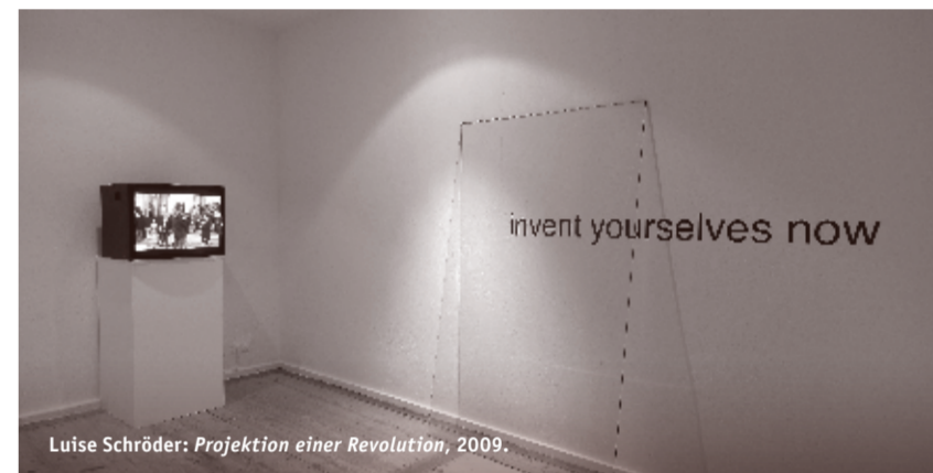
Luise Schröder: Projektion einer Revolution , 2009.