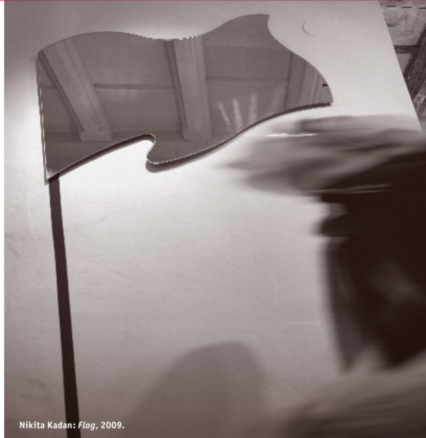
Nikita Kadan: Flag , 2009.