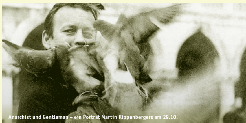
Anarchist und Gentleman – ein Porträt Martin Kippenbergers am 29.10.