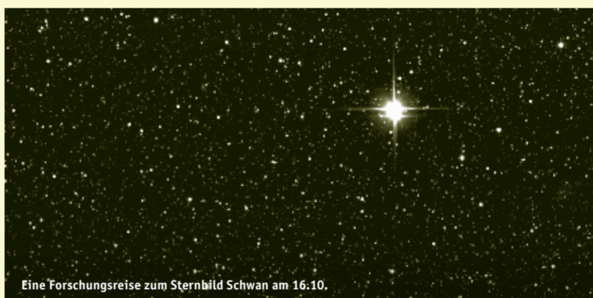
Eine Forschungsreise zum Sternbild Schwan am 16.10.