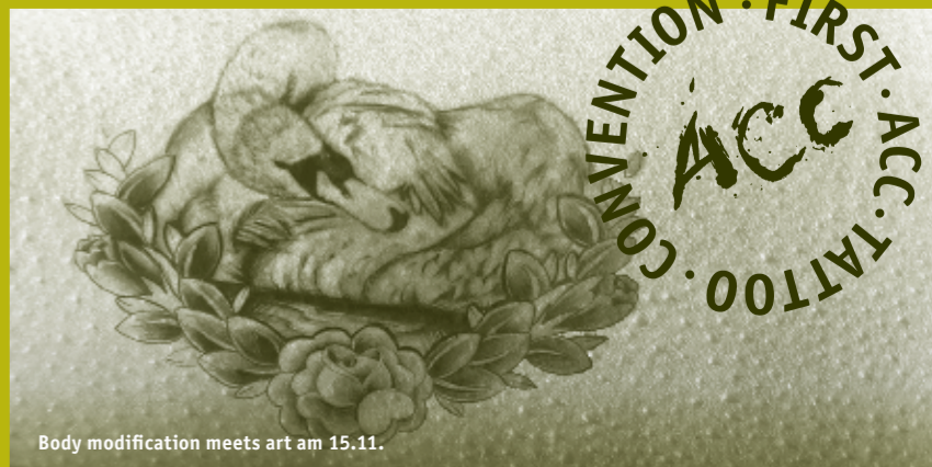
Body modification meets art am 15.11.

Die ACC Galerie Weimar richtet im Rahmen der aktuellen Ausstellung «Mein lieber Schwan» eine Tattoo Convention aus, in der sowohl Motive präsentiert als auch Tattoos gestochen werden. Wir suchen nach Tätowierern, die ihr Handwerk beherrschen und vor Ort arbeiten können. Wir suchen nach Tätowierern, die ihren Körperschmuck zeigen möchten. Im Kontext der Ausstellung legen wir die Priorität auf die Ästhetik und Anmut der Applikationen, auf Originalität der Motive und Techniken. Der kreative Umgang mit Stil, Schriften, Bildern, Innovationen und Methoden ist für die Teilnahme entscheidend. Wer will, wer hat, wer kann, wer darf, wer ist dabei? Wer hat sich der künstlerischen Gestaltung menschlicher Körper verschrieben? Bei Interesse an einer Teilnahme, ob als Künstler oder Gast, meldet Euch / melden Sie sich unter: kultur@acc-weimar.de