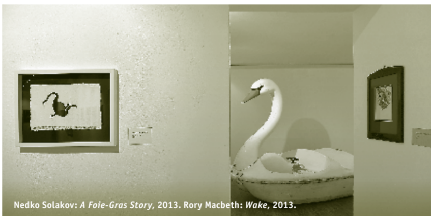
Nedko Solakov: A Foie-Gras Story , 2013. Rory Macbeth: Wake , 2013.

Di 15.10.2013 | 20:00 plus zur aktuellen Ausstellung