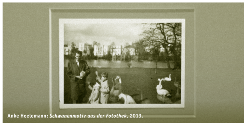
Anke Heelemann: Schwanimotiv aus der Fotothek , 2013.