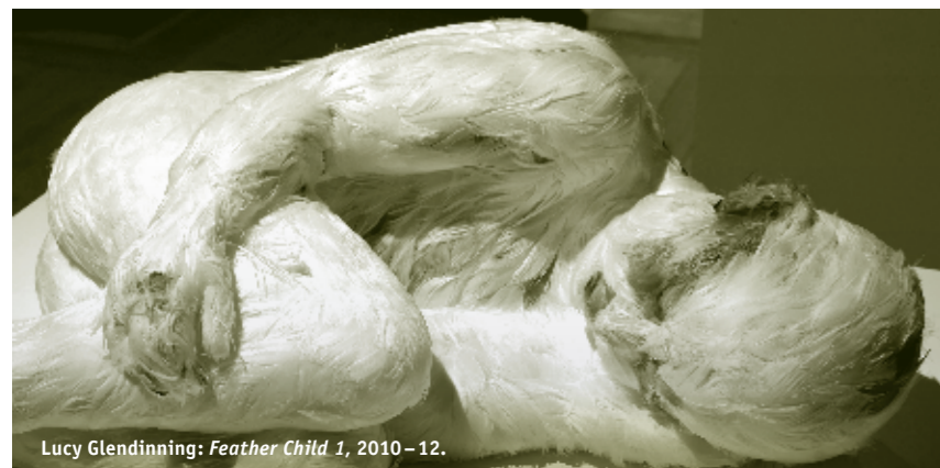
Lucy Glendinning: Feather Child 1 , 2010 – 12.