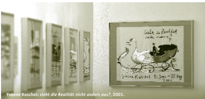
Yvonne Kuschel: sieht die Realität nicht anders aus? , 2001.