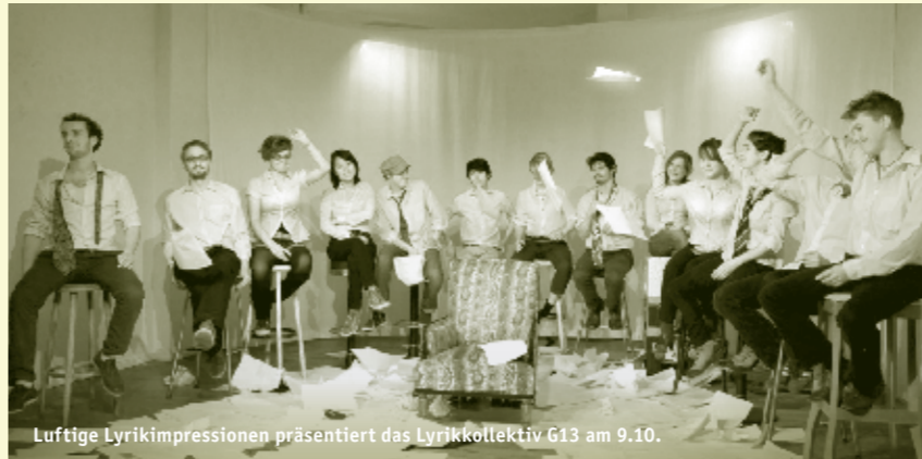
Luftige Lyrikimpressionen präsentiert das Lyrikkollektiv G13 am 9.10.

Mi 9.10.2013 | 20:00 Performative Lesung