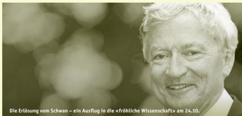
Die Erlösung vom Schwan – ein Ausflug in die «fröhliche Wissenschaft» am 24.10.