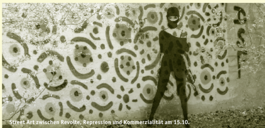
Street Art zwischen Revolte, Repression Und Kommerzialisität am 15.10.